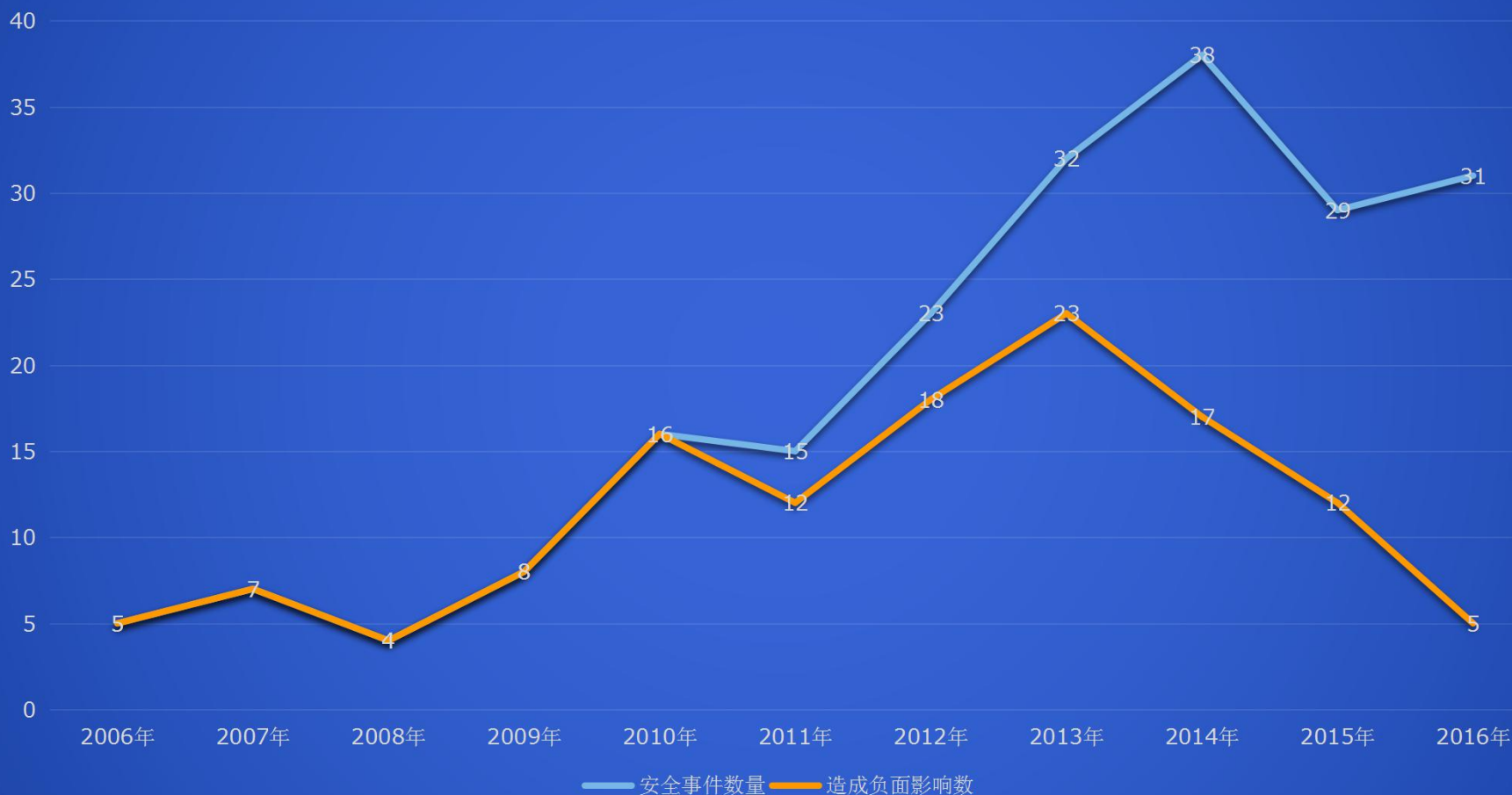
校内网络信息安全事件数量统计