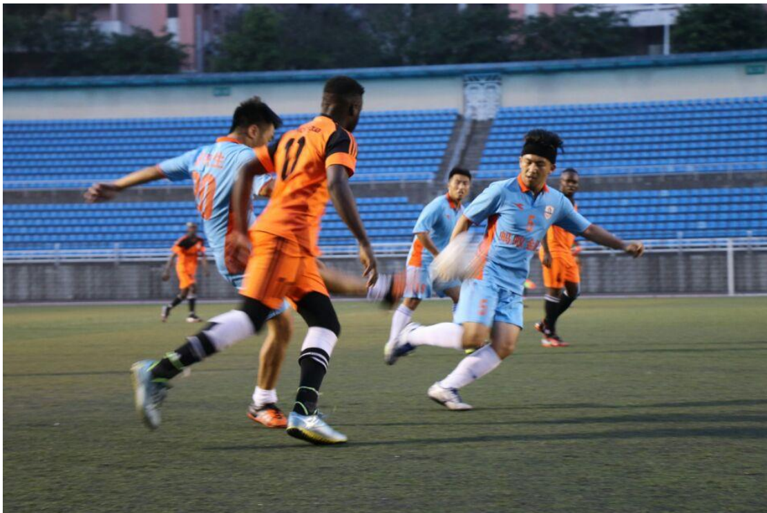
研究生队获“青春杯”男子足球赛、太极之夜·第一届”运动重邮“足球决赛第二名

我校每年的篮球赛、排球赛和足球赛事（青春杯、安踏杯等），充分展示了我校研究生勇于拼搏、积极健康、乐观向上的精神风貌，为浓厚青春、健康、和谐的校园文化氛围起到了积极的推动作用。