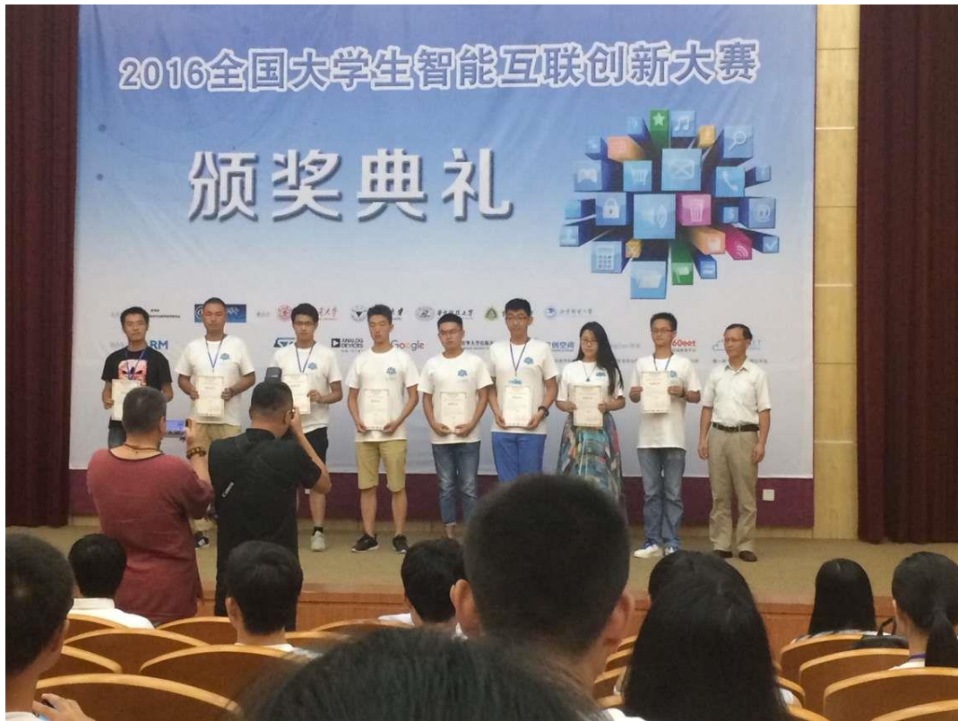
2016年全国大学生智能互联创新大赛颁奖典礼