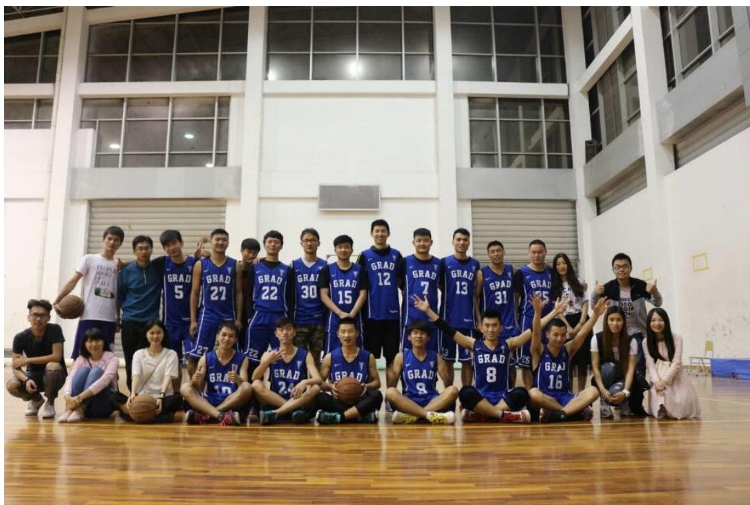
第一届“运动重邮”之“青春杯”男子篮球比赛季军