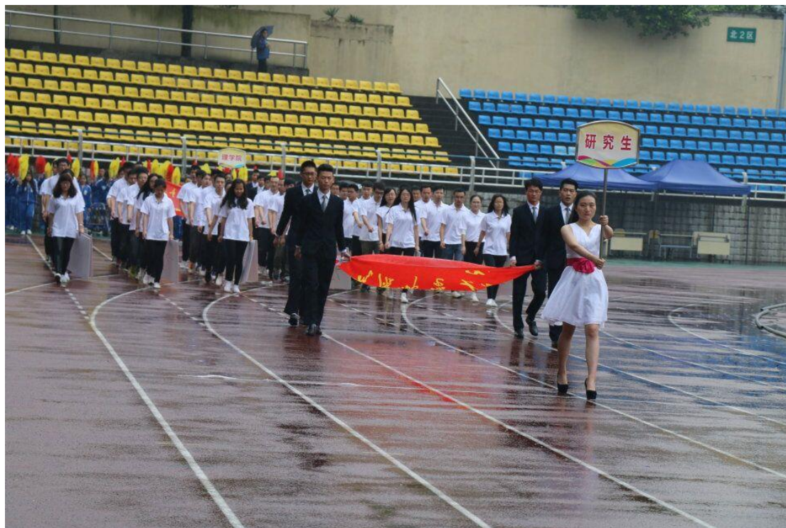
研究生获得重庆邮电大学第十一届学校田径运动会开幕式

我校推进体育运动深入开展,强化体育课和课外锻炼,促进研究生身心健康、体魄强健、全面发展,使研究生运动员们展现出更快、更高、更强的体育精神。