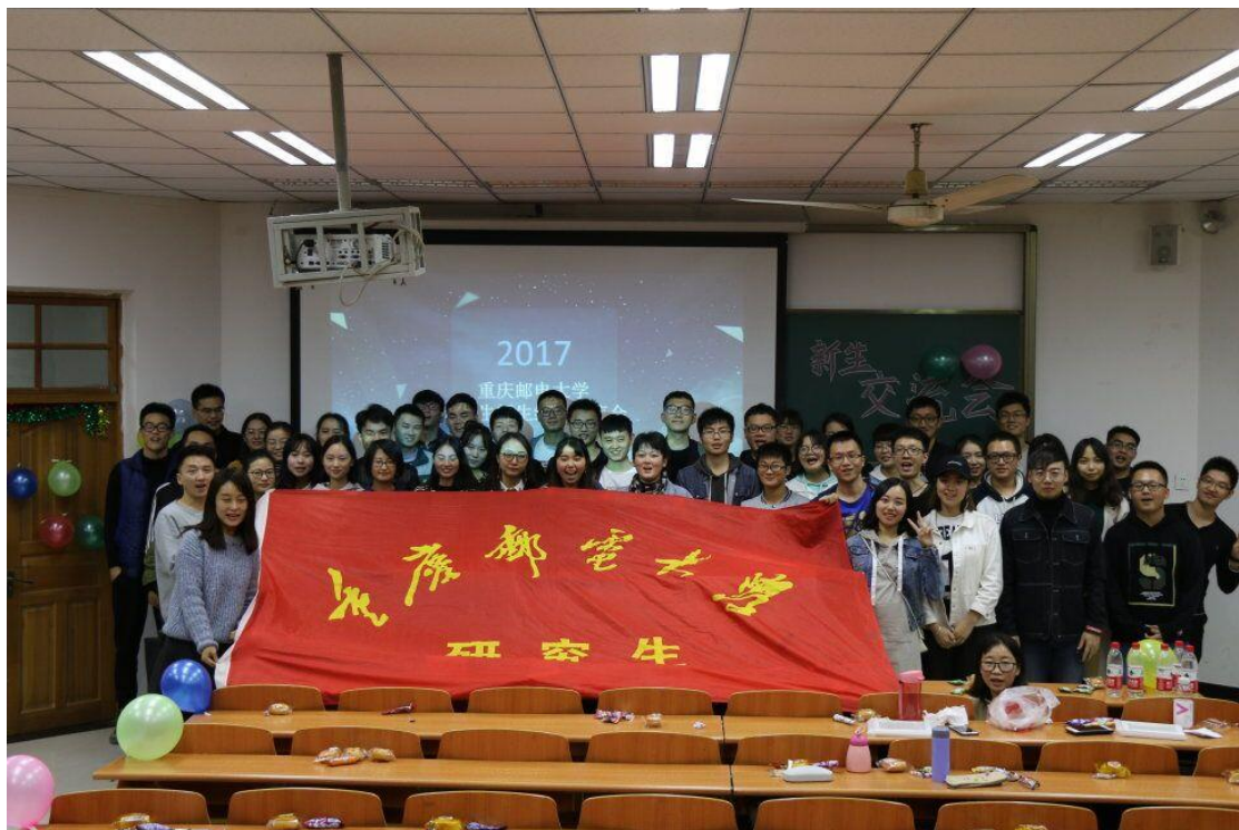
研究生新老干部交流会合影