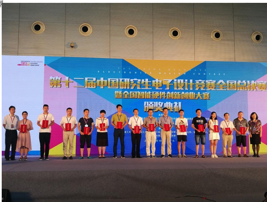
华为杯第十二届中国研究生电子设计竞赛我校获优秀组织奖（右五）

近年来，学校研究生教育在重庆市高校中发展快速，实力不断增强，人才培养质量进一步提高，为地方经济建设和社会发展做出积极贡献。这得益于学校高度重视研究生校园文化活动建设，稳步推进校园文化活动向深度和广度发展，发挥积极突出的育人功能，提升研究生的综合素质能力。搭建学术科技创新交流平台，提升研究生能力素养学校为各类科创活动发展提供支撑交流的平台，如项目申报经验交流会、数学建模培训讲座、互联网+项目集中辅导会、科技沙龙交流会等，营造科研创新氛围，鼓励更多研究生自主创新，投入到“创新创业”的大潮