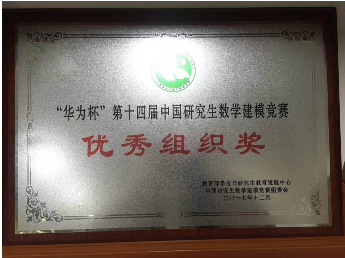
“华为杯”第十四届中国研究生电子数学建模竞赛优秀组织奖