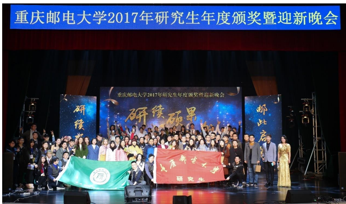
2017年研究生年度颁奖典礼暨迎新晚会工作人员合影留念