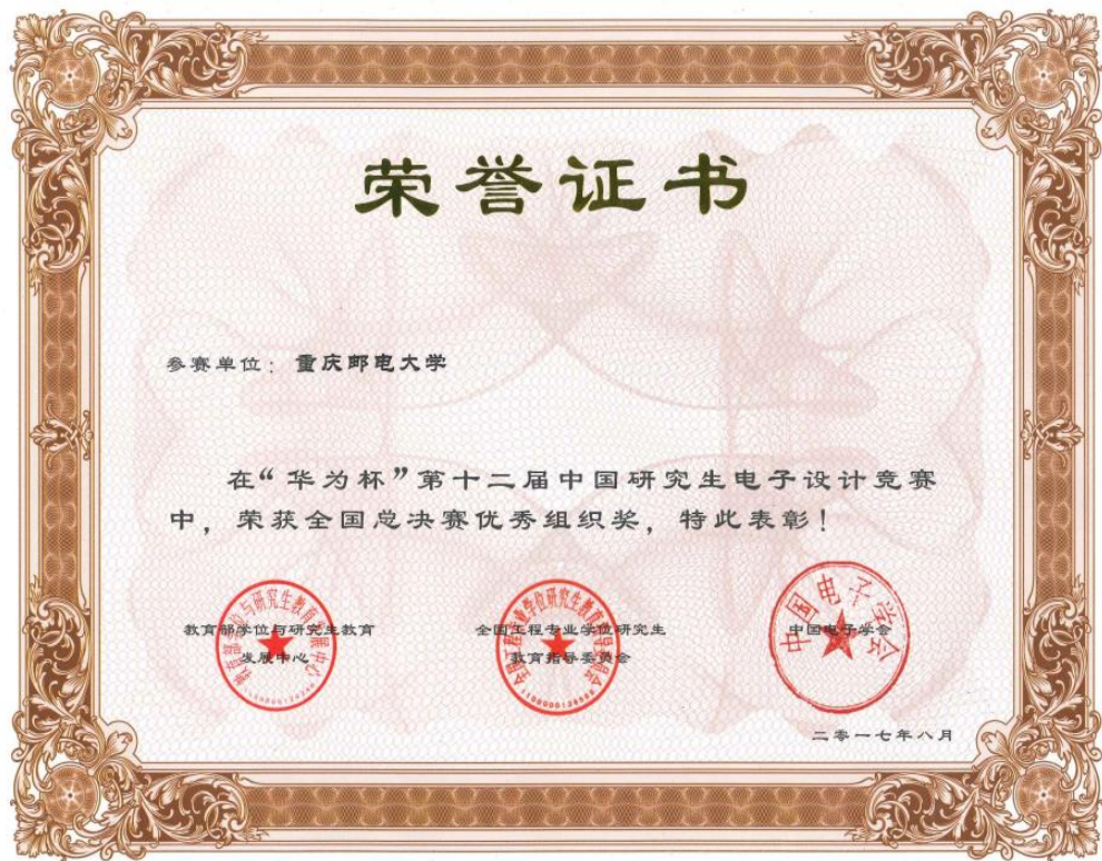
“华为杯”第十二届中国研究生电子设计竞赛全国总决赛组织奖