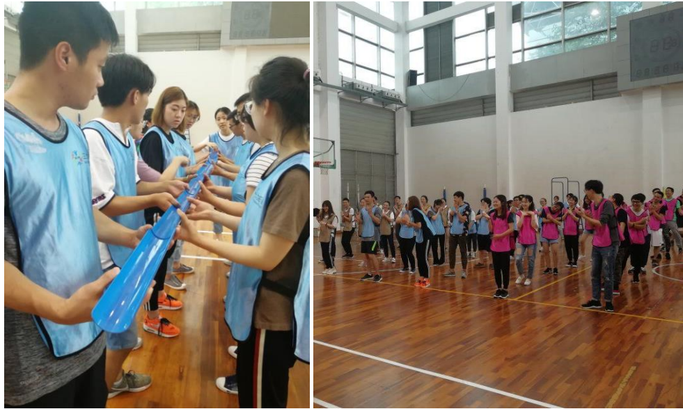
第十二届研究生会素质拓展活动（活动现场）