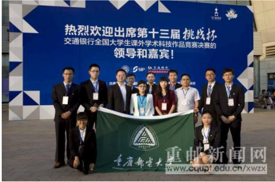
第十三届挑战杯决赛合照