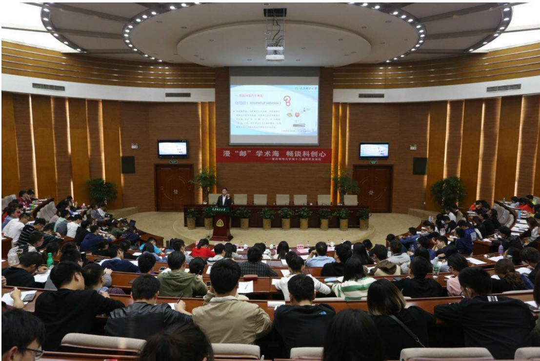
重庆邮电大学第十二届研究生论坛讲座开幕式

研究生校园文化活动建设紧跟时代进步和行业发展，举办信息通信领域的前沿学术报告，邀请专家教授、知名校友、行业精英和海归博士，为“研究生论坛”、“纵横通信”、“教授博士论坛”“数学物理进展论坛”等校院学术交流平台开展讲座，活动品牌效果明显，吸引了广大研究生的积极参与，也带动了研究生科研项目的踊跃申报。