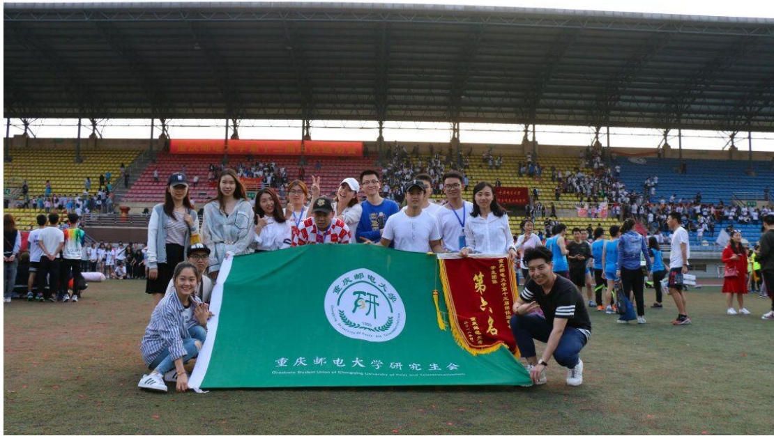
研究生获得重庆邮电大学第十三届学校田径运动会第六名