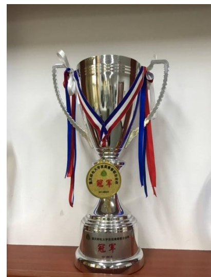
研究生在首届“青春杯”系列体育赛事、“迎新杯足球比赛”、“青春联合会杯”获得冠军