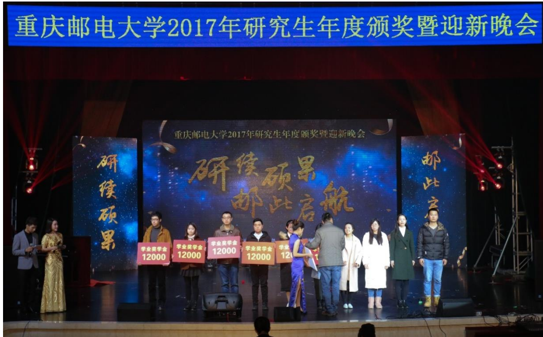
2017年研究生年度颁奖典礼暨迎新晚会——研究生奖学金和科创竞赛颁奖

学校研究生颁奖典礼暨迎新晚会在每年12月盛大举行，充分展示了我校研究生积极自信、乐观向上的精神面貌。丰富研究生的校园文化生活，搭建研究生风采展示和沟通交流的平台。