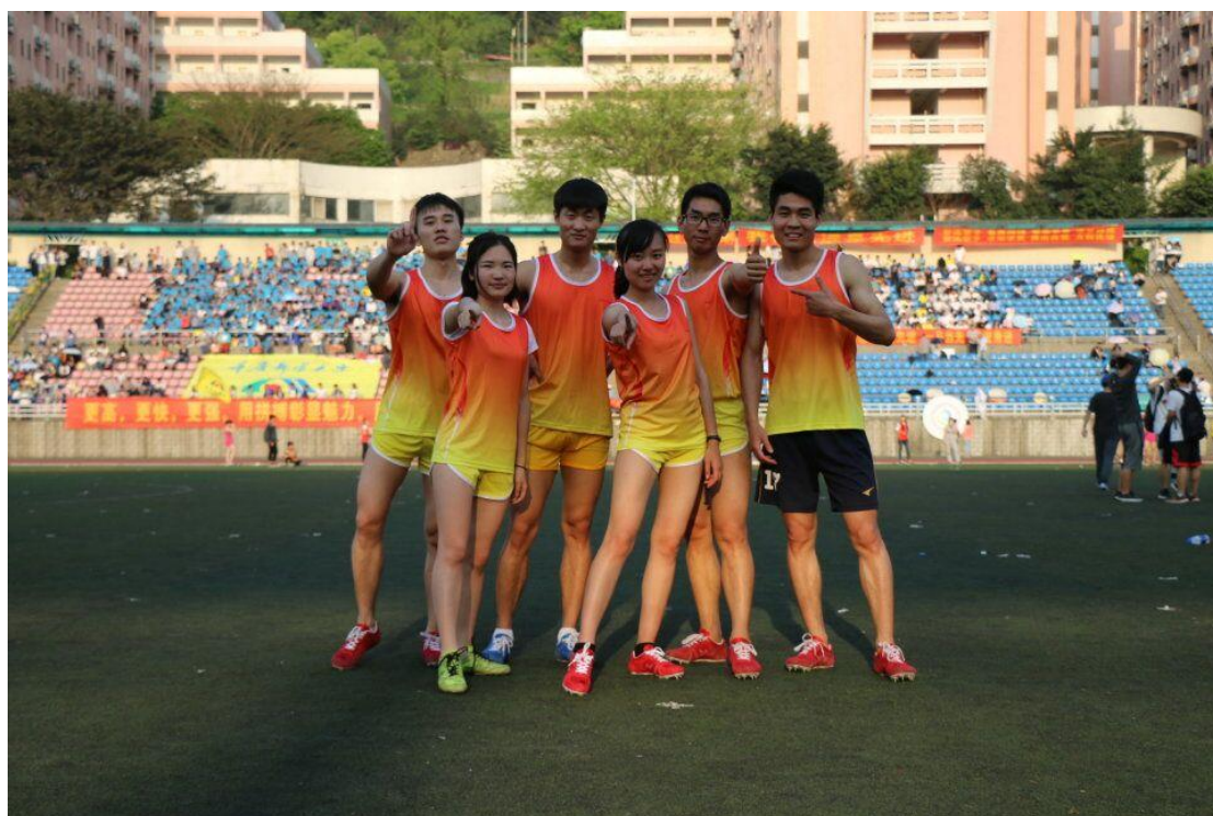
第十二届学校田径运动会田径类研究生参赛合影